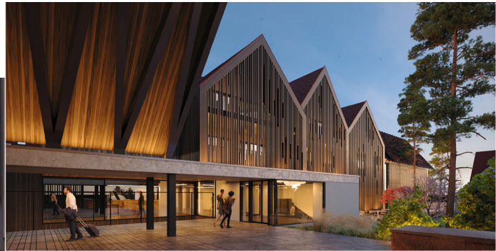
L'aspect extérieur du bâtiment sera également totalement repensé avec une toute nouvelle entrée, dans un style résolument contemporain avec une architecture bois et des matériaux alsaciens.