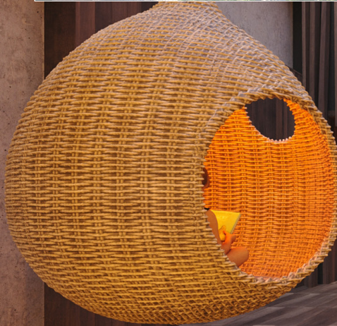
L'hôtel du Parc disposera d'un espace d'accueil impressionnant de par sa grandeur et sa décoration originale.