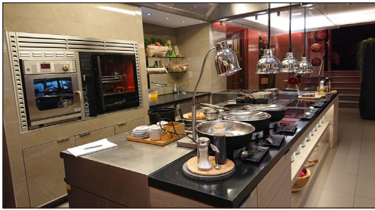
Le restaurant du spa sera réhabilité dans le but de servir également de salle de petit-déjeuner. Avec l'ajout d'une terrasse, le nombre de couverts passera de 30 à une centaine environ.