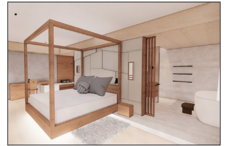
La partie hôtel passera d'une surface de 7 000 à 10 000 m 2 , sans pour autant augmenter le nombre de chambres. Ces dernières seront donc plus spacieuses et entièrement réinventées.