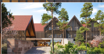
Cette rénovation énergétique se traduira par la mutualisation des productions de chaleur et de froid ou encore par l'installation de panneaux solaires participant à la chauffe des bassins.

Avec son tout nouvel aménagement, ses lignes épurées et ses matériaux bruts mais chaleureux, le Parc Hôtel modernise son image sans perdre pour autant son identité première.