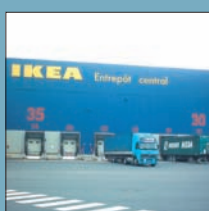
Plate-forme logistique France Espagne Portugal à Nancy (54)