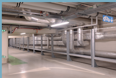
Face à la complexité d'un projet, ce sont les Hommes et l'efficacité de l'organisation qui font la différence.