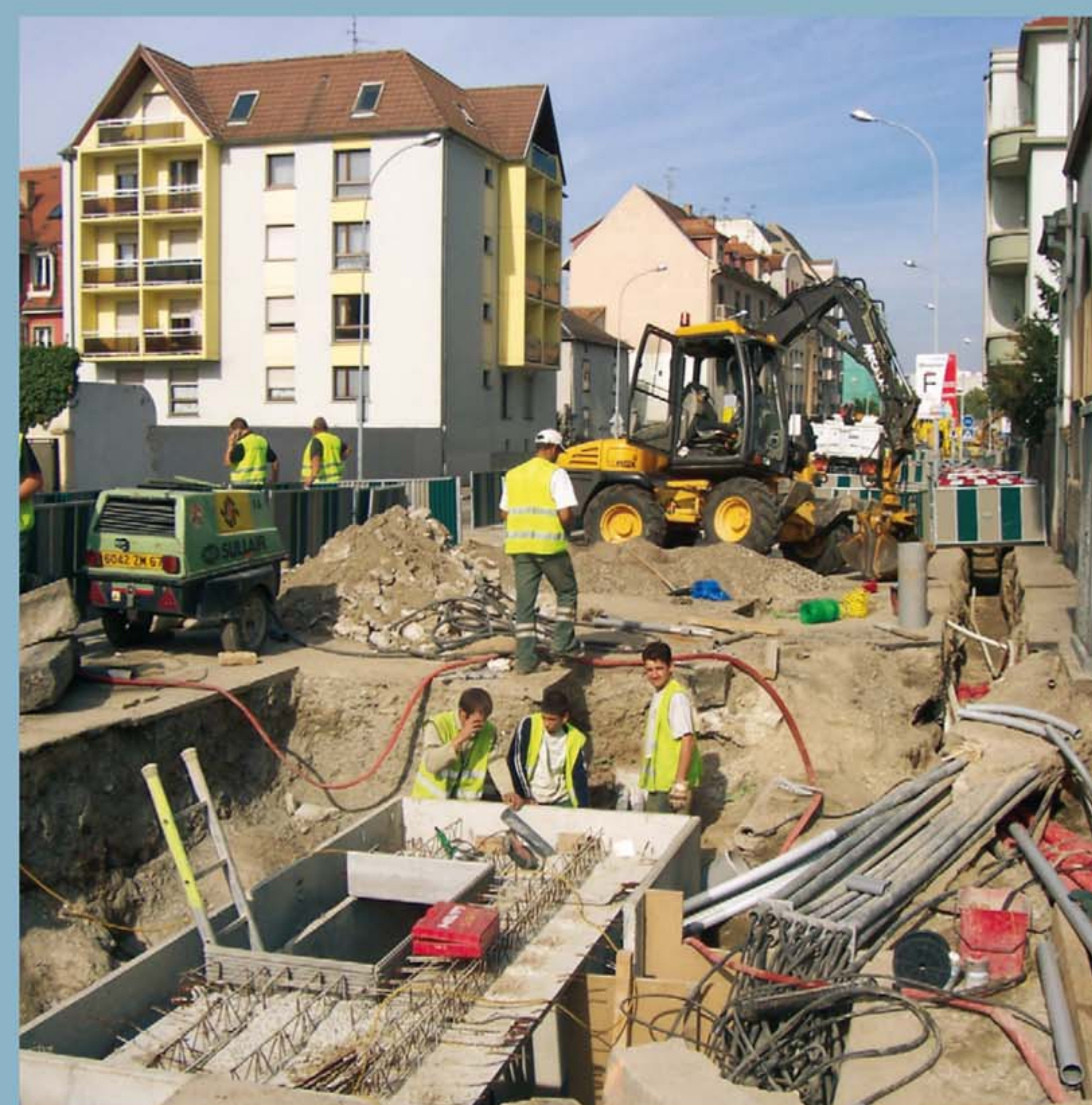
En phase travaux, le chef de projet peut compter sur l'appui de techniciens qui assurent le suivi des constructions.

En outre, sa démarche le conduit à mettre en œuvre des missions d'Ordonnancement, de Pilotage et de Coordination (O.P.C.) et à accompagner de nouveaux métiers complémentaires à l'exercice de la maîtrise d'œuvre comme les Coordinations en matière de Sécurité des Systèmes Incendie (C.S.S.I.) ou Sécurité et Protection de la Santé (C.S.P.S.).