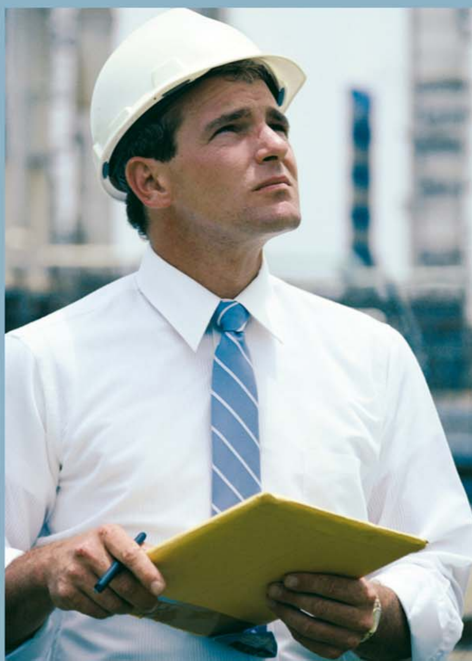
Le chef de projet est votre interlocuteur privilégié avec une compétence pluridisciplinaire.

Interlocuteur unique, il a pour mission d'organiser nos interventions et celles de nos partenaires, de coordonner leurs activités et de gérer les interfaces entre leurs différentes spécialités. Il peut ainsi établir la synthèse technique du projet, en maîtriser les coûts et faire respecter les délais contractuels.