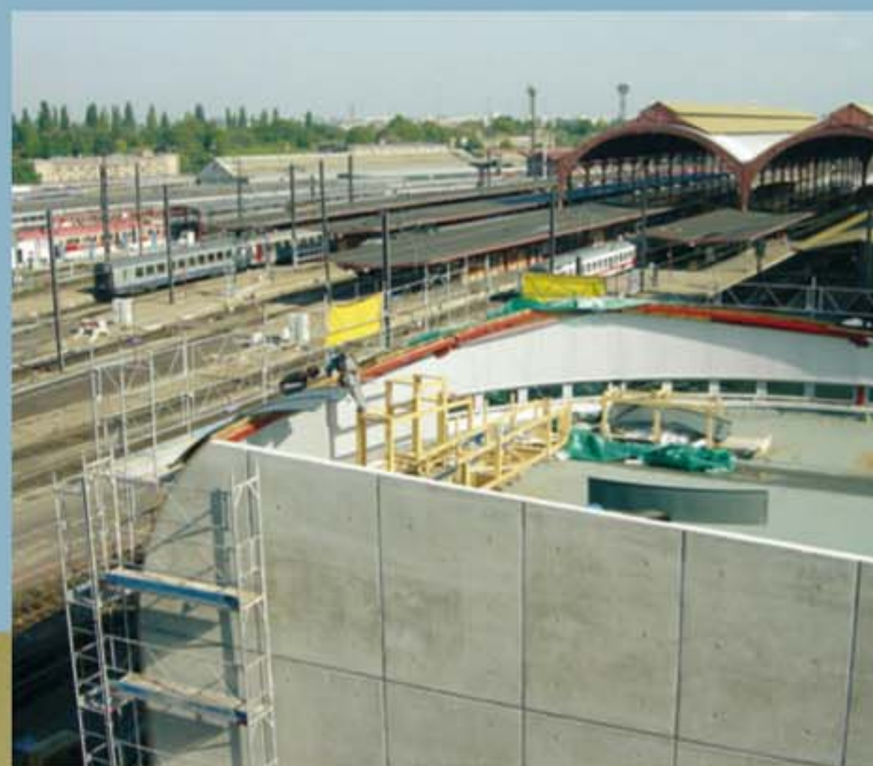
Le coordonnateur O.P.C. réalise en amont la planification des ouvrages, puis la coordination de l'ensemble des entreprises et leur ordonnancement.

Le coordonnateur O.P.C. anime les réunions de chantier, en assure la gestion ainsi que le suivi du phasage en concertation avec le maître d'ouvrage.