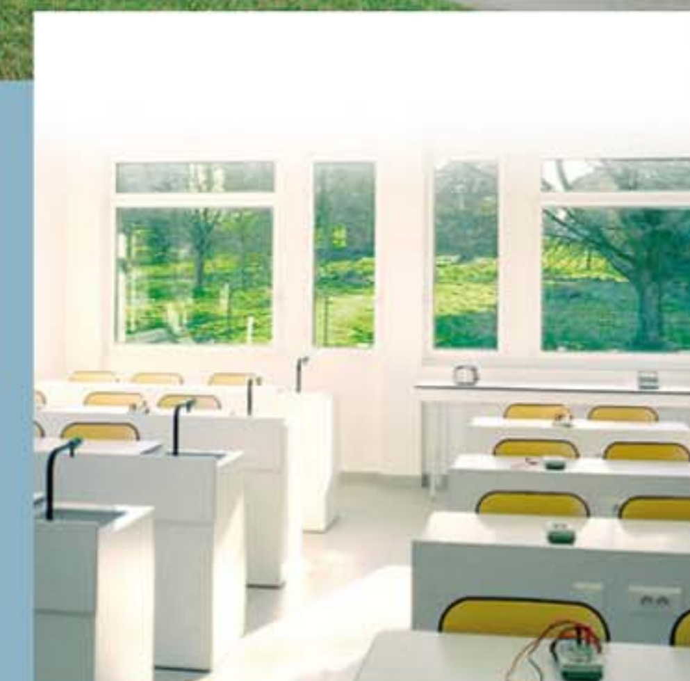
Photo : Collège Les Sources à Saverne. Architecte : Les Architectes SA